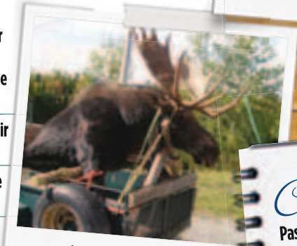
Original mâle de 12 1/2 ans, zone 4

Chasse Pas de chasse à la journée, seulement avec hébergement.