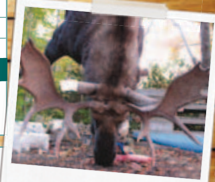
Original mâle de 50 po panache, zone 6