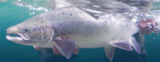
The Atlantic salmon in river