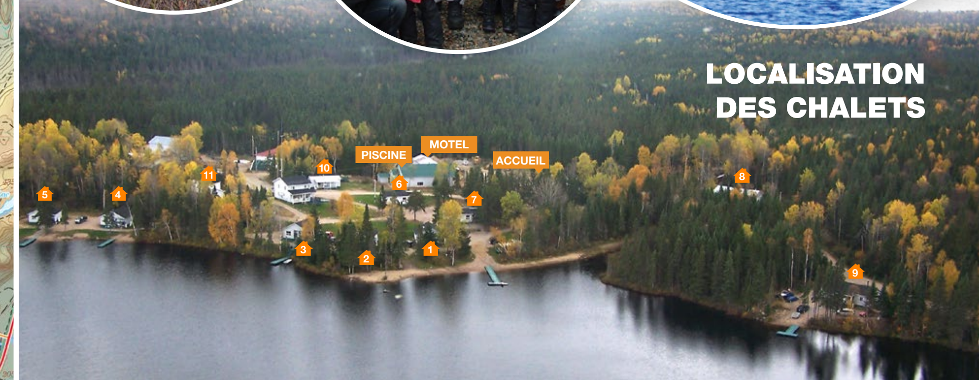
Lac à la Truite